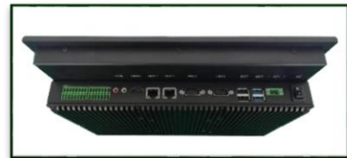
机身侧面接口展示