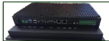
机身侧面接口展示